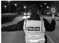
Sažetak aktivnosti u prometu tijekom proteklog tjedna 01.02.2021. 0 0