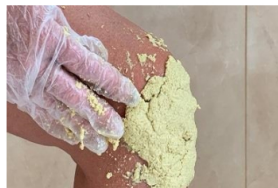
Trenutni učinak domaćeg recepta na zglobove. Bol nestaje već prvu večer