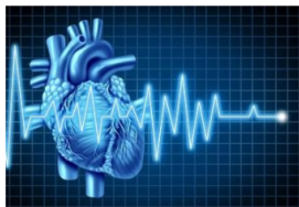
Kako izbjeći srčani udar? Učini ovo dvaput na dan