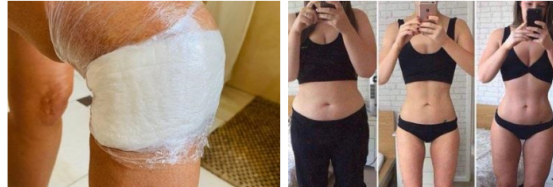
Trenutni učinak domaćeg recepta na zglobove. Bol nestaje već prvu večer