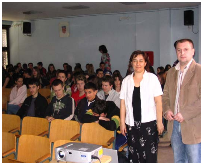
Na predavanju za učenike srednje škole