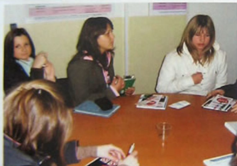
Za okruglim stolom upijamo kao spužve ...