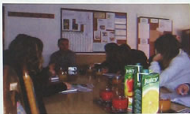
Pažljivo slušamo i bilježimo bitno ...