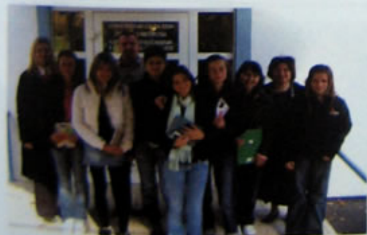
Pozdrav iz Centra !