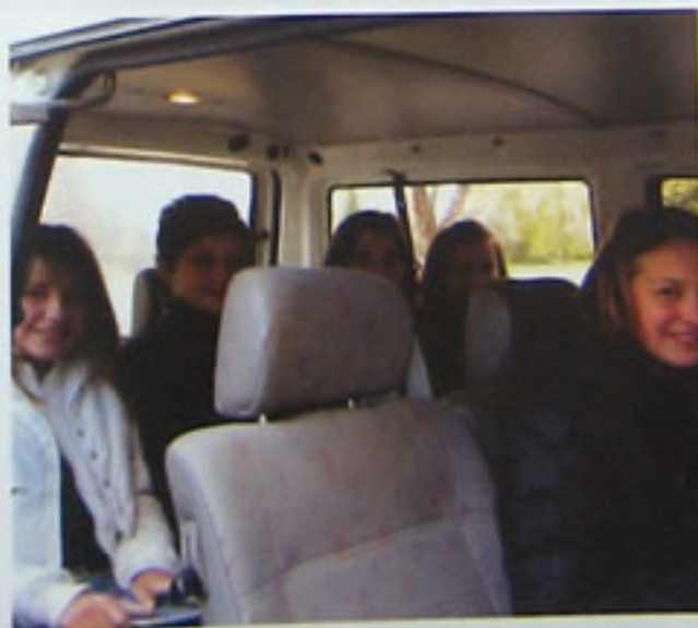
Do sljedećeg javljanja, ... bye, bye!